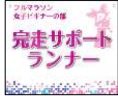
女性ビギナーの部 完走サポートランナー