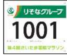
代表チャレンジャーの部