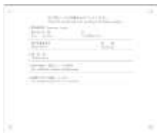
ナンバーカード裏面